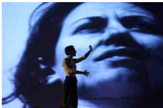
Rags of memory – Instabili Vaganti

La quinta edizione dedica un focus al progetto internazionale Stracci della Memoria, in occasione delle celebrazioni dei dieci anni di ricerca e formazione condotta in tutto il mondo da Instabili Vaganti nell'ambito del progetto che nasce nel 2006 con l'obiettivo di indagare la memoria intesa come parte integrante dell'essere umano, come condizione biologica e antropologica della propria esistenza ed esplora l'interazione del teatro con altre discipline quali l'antropologia culturale, le arti visive, i nuovi media, la danza, la musica e ogni altra forma ed espressione artistica. Stracci della Memoria ha come fine quello di attualizzare le tradizioni performative provenienti da differenti culture attraverso i nuovi media e i linguaggi del teatro contemporaneo. La caratteristica essenziale del progetto è quella di operare per sessioni di lavoro internazionali, dirette in differenti Paesi, alle quali possono partecipare performer provenienti da tutto il mondo. Alcuni degli artisti, che negli anni hanno preso parte al progetto, saranno ospitati in residenza al LIV – Performing Arts Centre per prendere parte ad uno scambio interculturale sulle pratiche performative tradizionali e contemporanee e per presentare il proprio lavoro all'interno del Festival PerformAzioni, dirigendo momenti di formazione, insieme a Instabili Vaganti.